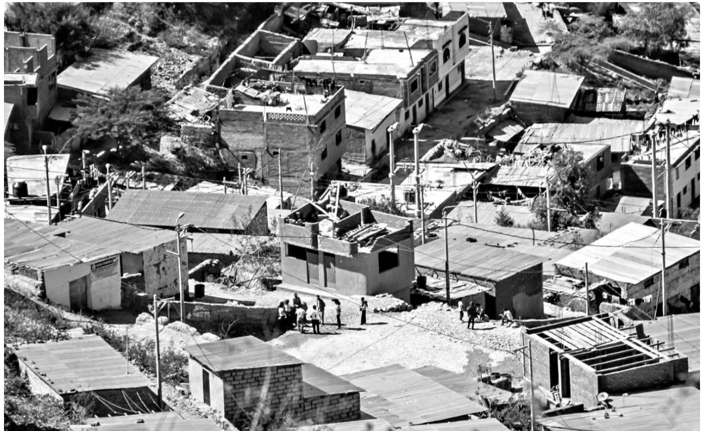
El gobierno de Dina Boluarte intentó en vano que el INEI no difundiera el informe «Perú: evolución de la pobreza monetaria 2014-2023».

Cifra supera a los niveles de pandemia, revela informe del INEI