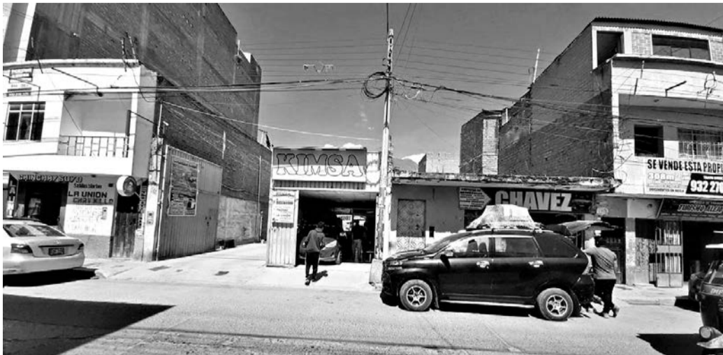
Transportistas demandan la intervención de las autoridades regionales y municipales.