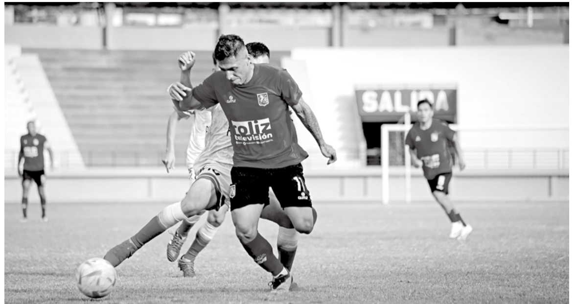
León de Huánuco FC saldrá con todo ante San Luis

Por otro lado, Real Esperanza y Defensor Ama-