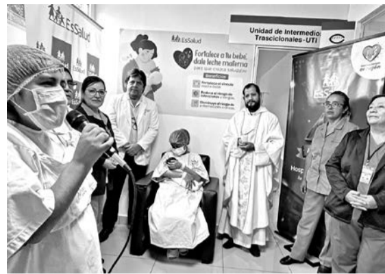
Ceremonia de inauguración.

Entre otras actividades por esta fecha, se programaron concursos y campeonatos entre los alumnos y exalumnos. Además, se invitó a una delegación del colegio San Luis Gonzaga de Ica «que tiene 280 años de funcionamiento, fue fundada en 1748 por edicto real», contó.