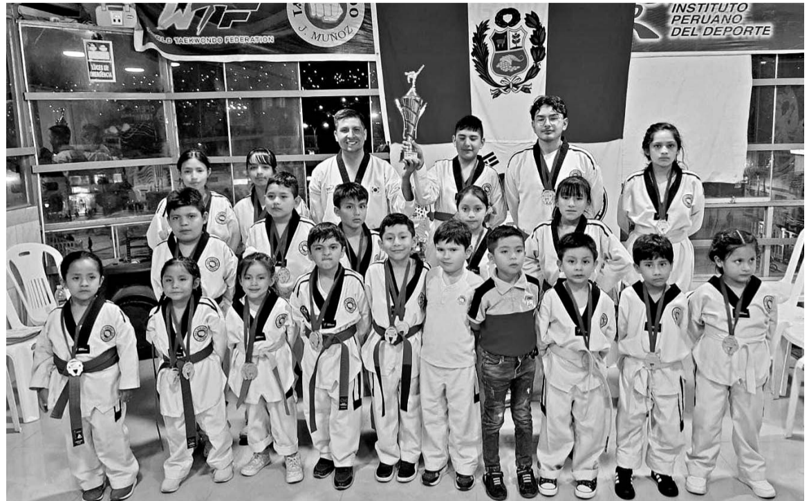
Taekwondistas lograron oro y plata en Huancayo.

Taekwondistas destacaron en Campeonato Nacional en Huancayo